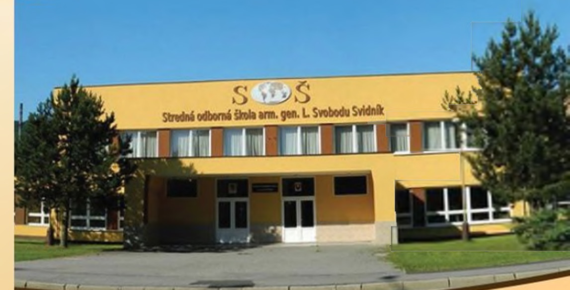
SOŠ polytechnická a služieb arm. gen. L. Svobodu Svidník